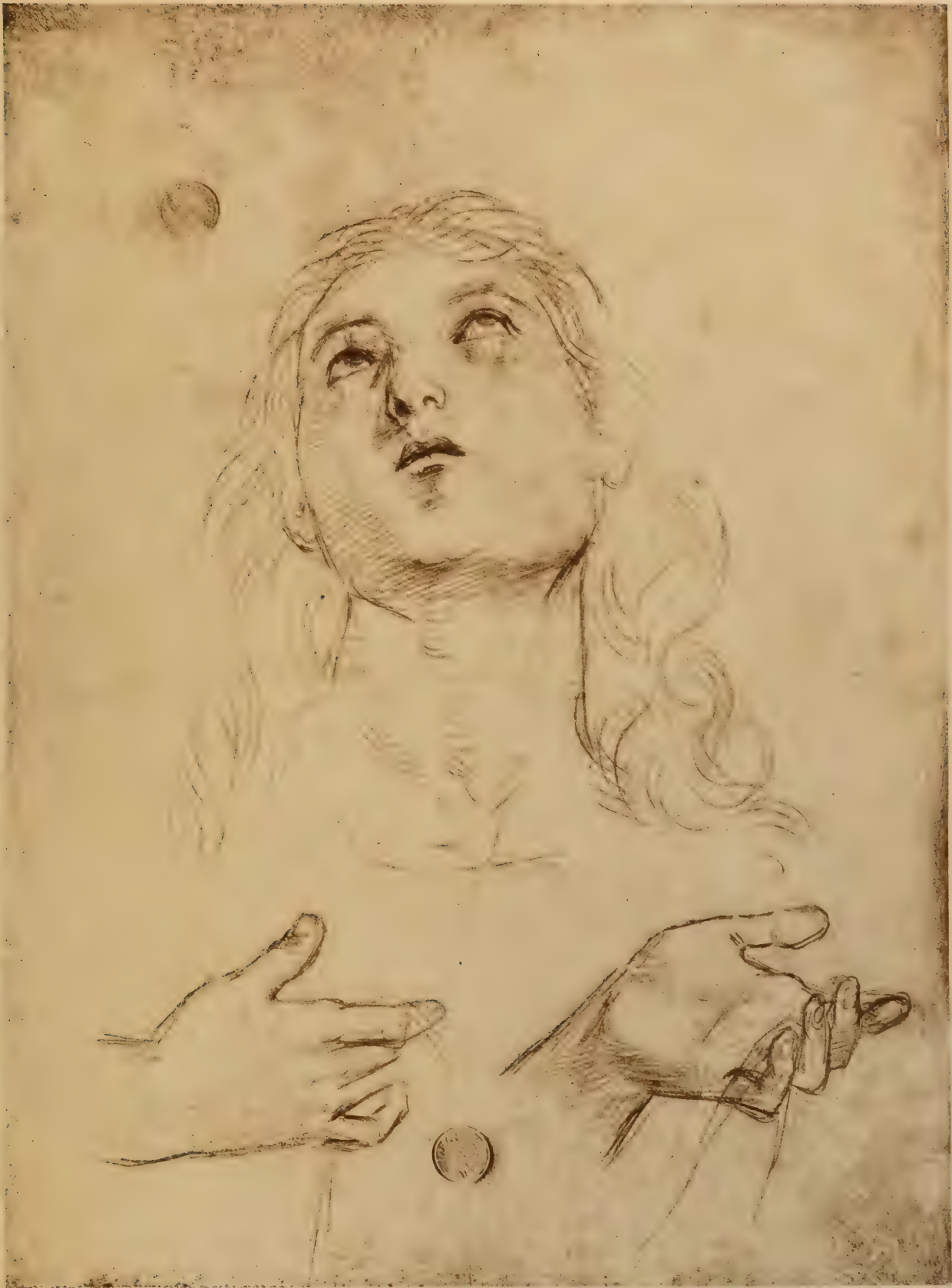
Dessin pour la tête et les mains du Saint Thomas du Couronnement au Vatican